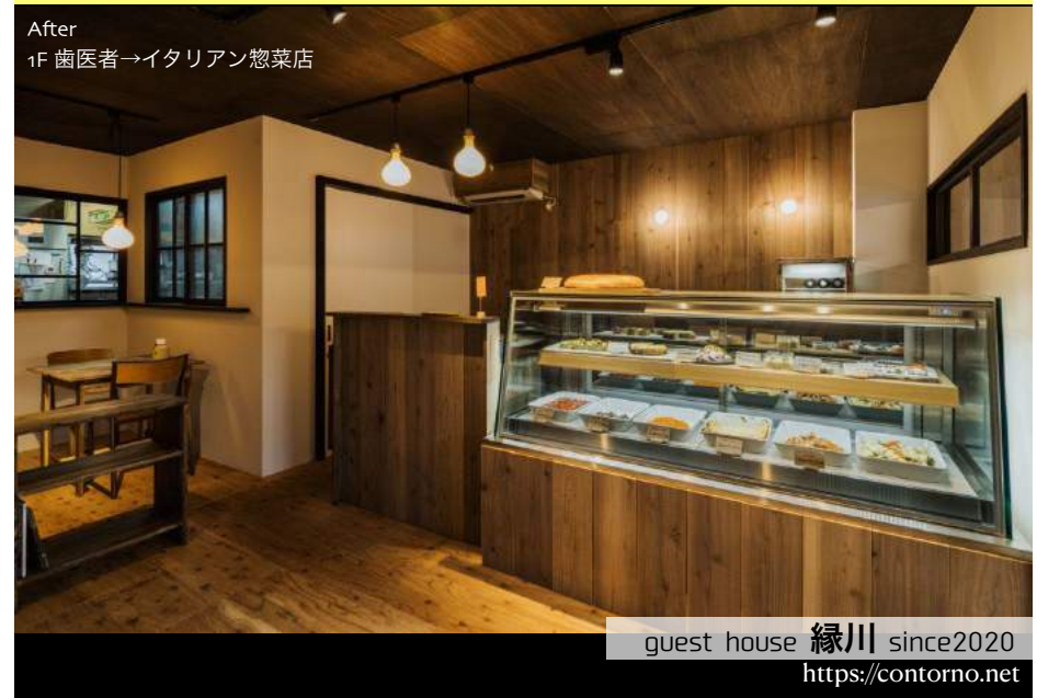
guest house 緑川 since2020 http://contorno.net