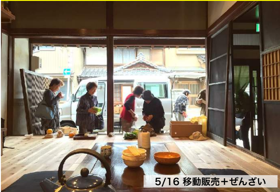
5/16 移動販売+ぜんざい