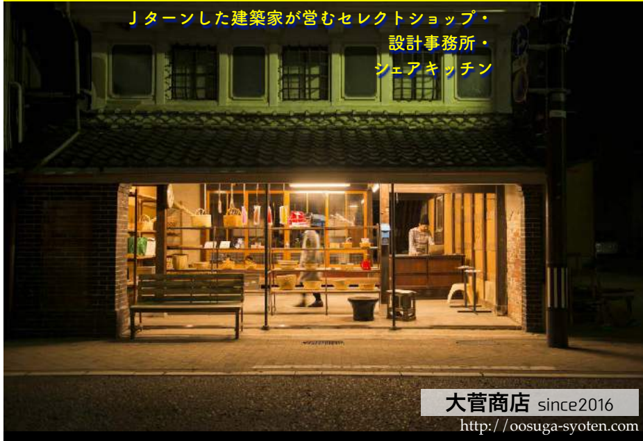
大菅商店 since2016 http://oosuga-syoten.com